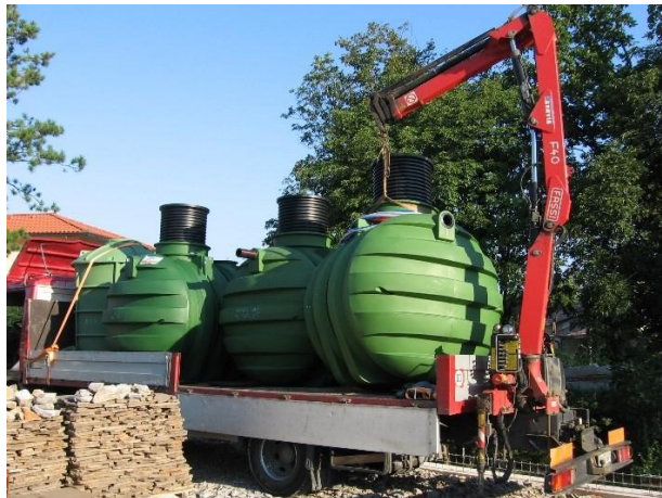
Obr. 1 – správný transport a manipulace

Nádrž by měla být připevněna polyesterovými pásky nebo pásky vyrobenými z podobných materiálů. Ujistěte se, že připevněné pásky nejsou příliš těsné, což by mohlo způsobit deformaci pláště nádrže.