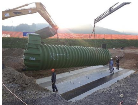
Obr. 4 – Instalace nádrže do stavební jámy

Před instalací nádrže je třeba zkontrolovat složení a vlastnosti půdy. Dno stavební jámy by mělo být zpevněné, a stabilní. V případě nedostatečné únosnosti půdy by měla být na dně vytvořena štěrkopísková vrstva podsypu o mocnosti 40 cm. Alternativně lze použít i betonovou podkladní desku o mocnosti 20 cm. Podklad nádrže musí být odolný vůči tlaku 60 MPa. Vykopaný materiál ze stavební jámy by měl být odstraněn, aby nebyl smíchán s plovivem. Je-li ve stavební jámě přítomna podzemní voda, musí být zcela vyčerpána.