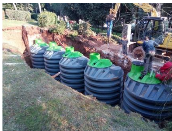
Obr. 5 – Řada nádrží

Velikost stavební jámy by měla být o 60-100 cm větší než velikost nádrže. Nádrž by měla být umístěna minimálně 150 cm od budovy a minimálně 200 cm od povrchů komunikací. Pokud to vlastnosti terénu umožňují, měly by být stěny stavební jámy vykopávány co nejvíce svisle (je třeba vzít v úvahu bezpečný úhel výkopu a pravidla bezpečnosti práce). Musí být respektovány platné předpisy o bezpečnosti práce a stavebnictví. Hloubka stavební jámy musí být přizpůsobena projektům a rozměrům nádrže.