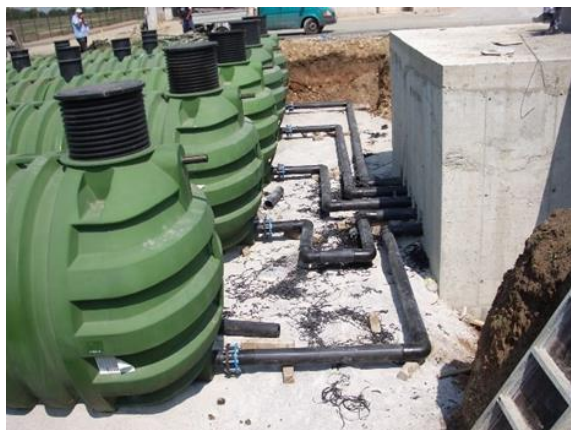
Obr. 7 – Základová deska

Do základové desky musí být namontovány kotevní háky (ocelové výztužné tyče o průměru 20 mm). K háčkům by mělo být připevněno lano (průměr 12 mm) s drátěnými svorkami. Lano by mělo být utaženo háčkem napínáku. Všechny upevňovací materiály by měly být vyrobeny z nerezové oceli. Aby se zabránilo přímému tlaku na nádrž, je třeba mezi povrch nádrže a lano umístit geotextilii (šířka cca 100 mm). Nádrže s manipulačními kroužky by měly být ukotveno k háčkům na manipulačních kroužcích.