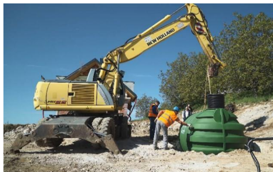
Obr. 3 – Instalace nádrže

Nádrž by měla být skladována na vhodném hladkém a rovném povrchu. Ujistěte se, že na povrchu nejsou žádné ostré předměty, které by mohly nádrž poškodit. Pokud by na nádrži došlo před instalací k jakémukoli poškození, je třeba o tom neprodleně informovat výrobce. Opravy by měly být prováděny podle písemných pokynů výrobce.