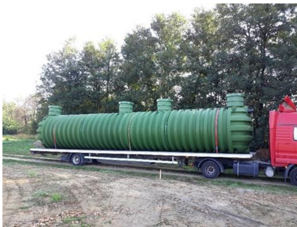
Obr. 2 – Přeprava nádrží