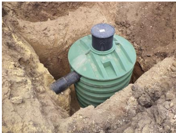
Obr. 6 – Nádrž usazená na svém místě

Nádrž by měla být obsypána štěrskem frakce 4 - 16 mm. Sypání a hutnění štěrku by mělo být prováděno v několika fázích, tj. ve vrstvách o tloušťce 300 mm. Během instalace by měla být nádrž naplněna vodou na stejnou úroveň jako výška obsypového materiálu, takže vnitřní i vnější hladina jsou stejné. To umožňuje stejný boční tlak na stěnu nádrže. Při obsypu štěrskem musí být nástavce a kryty našroubovány do nádrže.